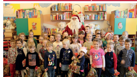
PRZEDSZKOLE - SP - KOSZYCE MAŁE