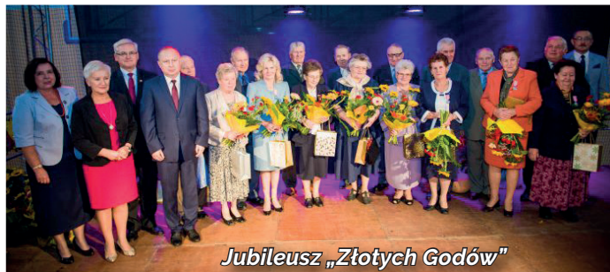
Jubileusz „Złotych Godów”