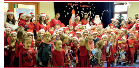
PRZEDSZKOLE - ZGŁOBICE - KRAINA MARZEN