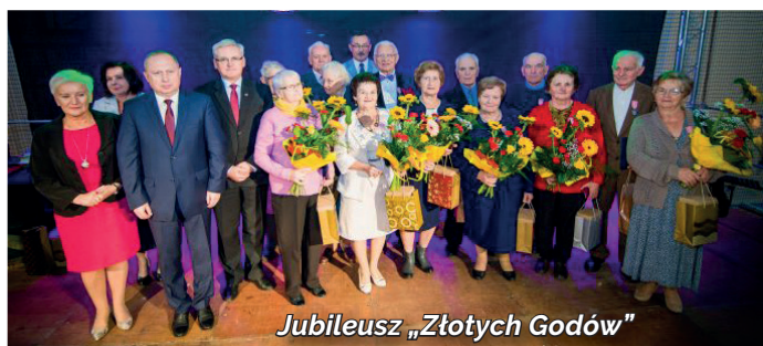
Jubileusz „Złotych Godów”