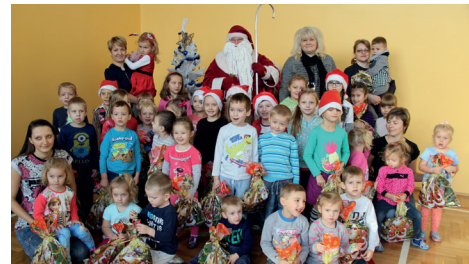
ZESPÓŁ SZKOLNO-PRZEDSZKOLNY - ŁĘKAWKA