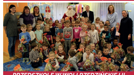
PRZEDSZKOLE W WOLI RZĘZIŃSKIEJ II