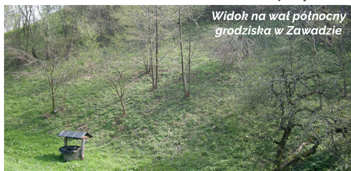
Widok na wał północny grodziska w Zawadzie