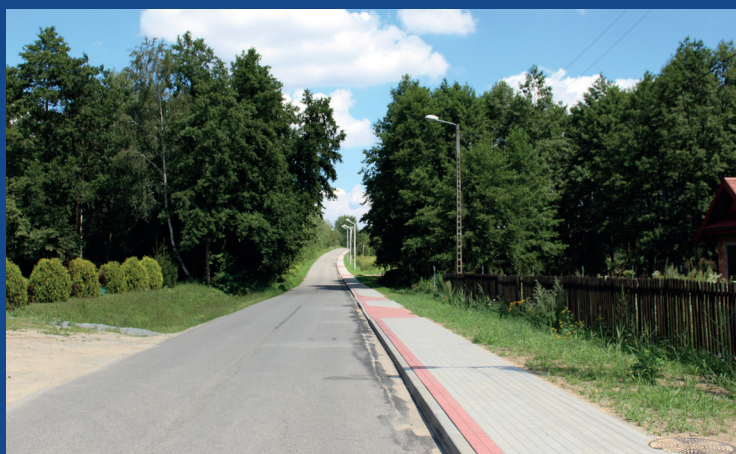
Ścieżka rowerowa w Woli Rzędzińskiej II