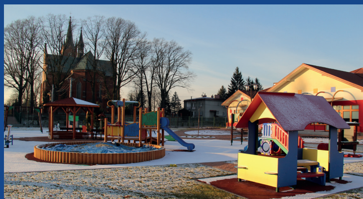
Plac zabaw w Woli Rzędzińskiej

Jaki dla gminy Tarnów był miniony rok w inwestycjach? Krótko mówiąc: przybyło dróg i nakładek asfaltowych, chodników, wyremontowana została hala sportowa, przedszkole, boiska, ulice, drogi, nawierzchnie publicznej. Sporo udało się zrealizować dzięki pozyskaniu funduszy z Ministerstwa Spraw Wewnętrznych i Administracji. W związku z oczekiwaniem na nowy okres programowania, nie by