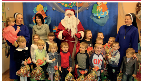
PRZEDSZKOLE W NOWODWORZU