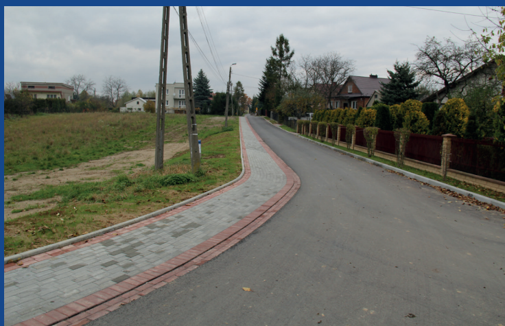
Wyremontowana ulica Południowa w Tarnowcu

Łącznie daje to blisko 2 kilometry nowych nakładek asfaltowych, które dzięki sprzyjającym warunkom atmosferycznym i łagodnej porze jesiennej, wykonywane były do końca listopada.