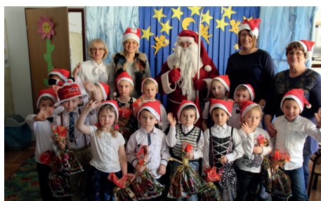
SZKOŁA PODSTAWOWA - PORĘBA RADLNA