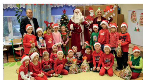
SZKOŁA PODSTAWOWA - WOLA RZĘZIŃSKA I

„Zima z Mikołajem jest pachnącym, ciepłym majem...” - między innymi takimi słowami witały swojego ulubionego świętego dzieci z gminnych przedszkoli i oddziałów przedszkolnych, które w pierwszych dniach grudnia odwiedził Święty Mikołaj. Jak się okazało, wszystkie przedszkolaki były w tym roku bardzo grzeczne, gdyż prezentu nie zabrakło dla żadnego z nich. Dzieci z tej okazji przygotowały piękne piosenki oraz wierszyki. Jak zdradził Święty Mikołaj, paczki dla gminnych przedszkolaków, których było ponad tysiąc sto, pomagali mu przygotować pomocnicy - pracownicy gminnego Centrum Animacji Kulturalnej.