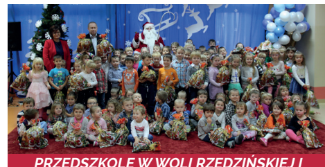
PRZEDSZKOLE W WOLI RZĘZIŃSKIEJ I