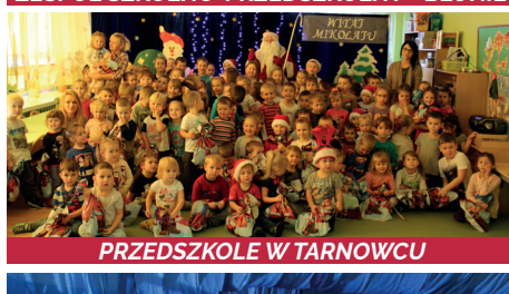
PRZEDSZKOLE W TARNOWCU