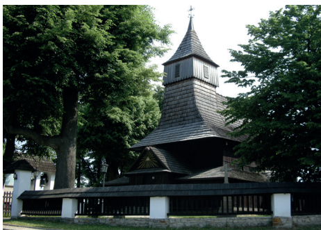
Kościół św. Marcina w Zawadzie od południowego zachodu