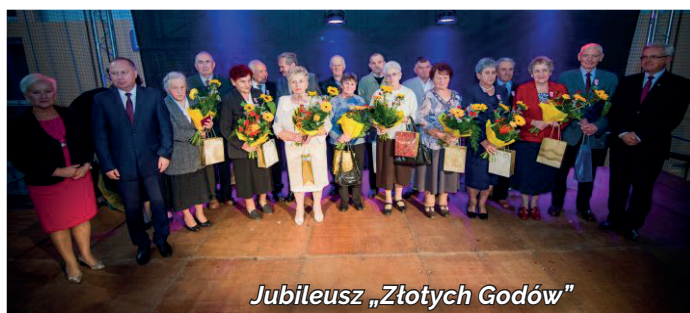
Jubileusz „Złotych Godów”