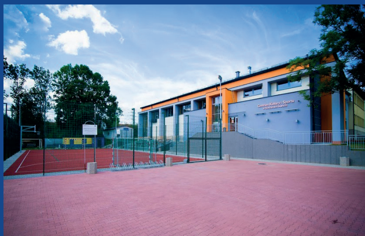
Centrum Kultury i Sportu w Koszycach Małych