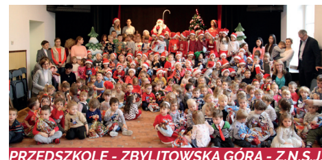
PRZEDSZKOLE - ZBYLITOWSKA GÓRA - Z.N.S.J.