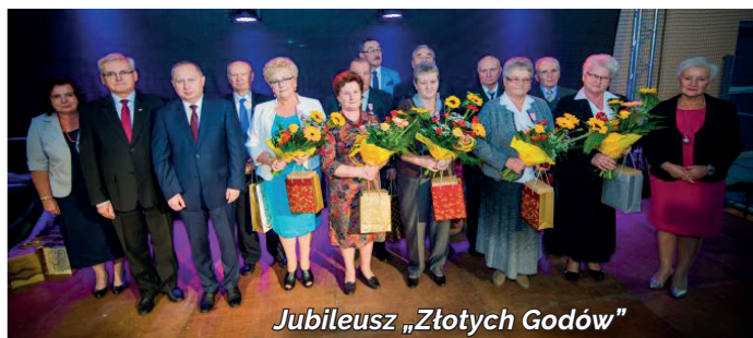
Jubileusz „Złotych Godów”