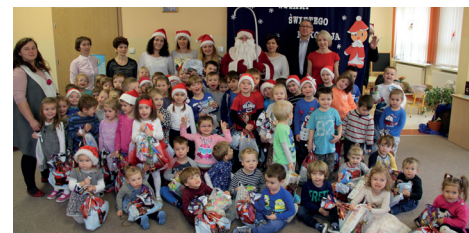
PRZEDSZKOLE - ZBYLIT. G. - POD KASZTANAMI