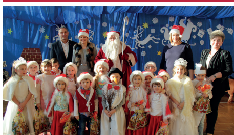
SZKOŁA PODSTAWOWA - ZAWADA