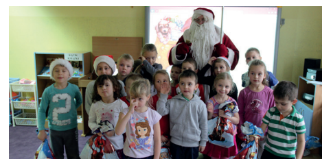
ZSP KOSZYCE WIELKIE