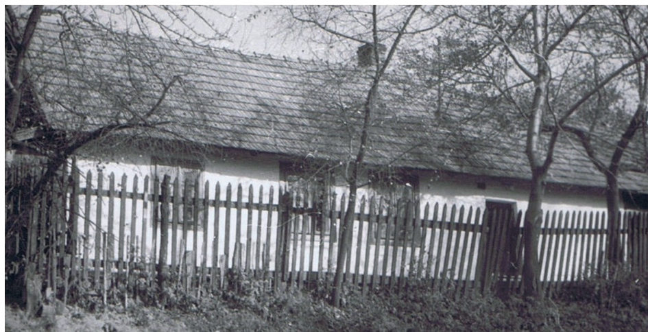
Chatupa nr 10 z 1910 r. (nieistniejąca)

(obecnie północno-zachodnia część Zawady), w której zamieszkali m.in. rzemieślnicy i służba zamkowa.