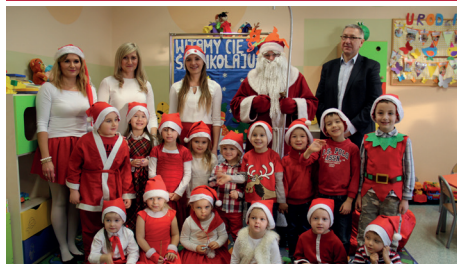
ZESPÓŁ SZKOLNO-PRZEDSZKOLNY - BŁONIE