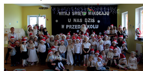
PRZEDSZKOLE - RADLNA - „SŁONECZKO”